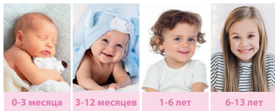
0-3 месяца 3-12 месяцев 1-6 лет 6-13 лет